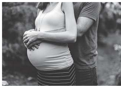
Am Infoabend können werdende Eltern ihre Fragen rund um die Geburt klären.

Wil Damit werdende Eltern ihre Fragen rund um die Geburt klären und das Team der Geburtshilfe im Spital Wil kennenlernen können, findet am Mittwoch, 5. Oktober, von 19.30 bis circa 21 Uhr ein Infoabend statt. Eine Kaderärztin oder ein Kaderarzt sowie eine diplomierte Hebamme stellen Gebärmöglichkeiten und mögliche Mittel zur Schmerzlinderung während der Geburt vor, gehen auf die Nachbetreuung des Neugeborenen und der Mutter ein und führen die Teilnehmenden nach Möglichkeit durch die Gebärdzimmer. Beim anschließenden Apéro stehen die Fachpersonen der Klinik Gynäkologie und Geburtshilfe im Spital Wil für Fragen zur Verfügung. Ebenso vor Ort ist eine Mitarbeiterin der Mütter-Väterberatung sowie der Kindertagesstätten Wil. Weitere Infos unter www.geburt-wil.ch pd/dot