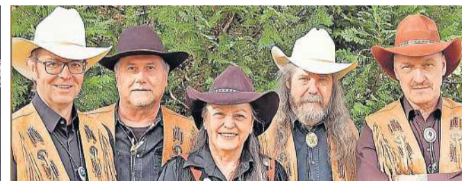
Underline und The Tennessee Heartbreakers (v.l.) treten dieses Wochenende im «Heaven» in Balterswil auf.