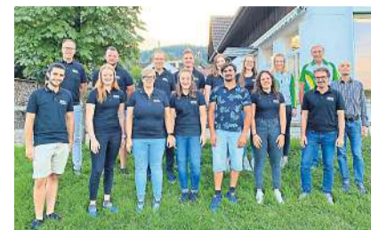
Das OK Hinterthurgauer Jugitag und die zuständigen Funktionäre des TGTV z.V.g.

Wil Am 18. Juni 2023 wird es so weit sein. Viele lachende Kindergesichter tummeln sich auf den Rasenplätzen und in der Halle des Schulhauses Ägelsee und der Primarschule Wilen. Der Hinterthurgauer Jugendturntag wird im kommenden Sommer im Wilen stattfinden. An diesem Anlass messen sich Kinder von der ersten Klasse bis zur Oberstufe in unterschiedlichen Disziplinen. Einzelwettkämpfe stehen am Morgen auf dem Programm. Der Nachmittag wird mit Gruppenwettkämpfen und Plauschspielen gestaltet sein. Das OK arbeitet bereits auf Hochtouren, um diesen Anlass termingerecht zu organisieren. Halten auch Sie sich bereits jetzt das Datum im Kalender frei. Gäste und Zuschauer sind willkommen und erfreuen sowohl die teilnehmenden Kinder als auch den Turnverein Ägelsee, der als Organisator hinter dem Anlass steht. pd/dot