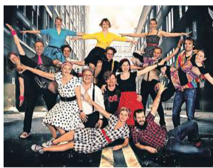
Am Tanz- und Unterhaltungsabend dieses Wochenende zeigen die «Rock Sliders» ihr neues Programm.

Der Rock'n'Roll-Club Rock Sliders aus Bichelsee-Balterswil feiert am 1. Oktober sein 25-jähriges Jubiläum und organisiert einen Tanz- und Unterhaltungsabend.